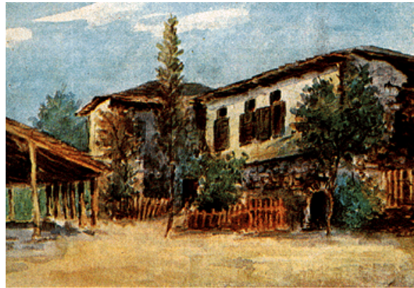
Σχολείο του Ρήγα στη Ζαγορά Πηλίου