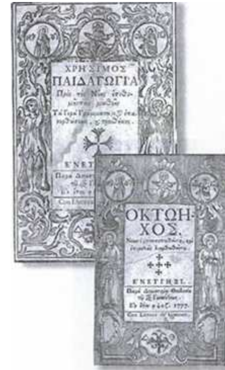
Βιβλία στην Τουρκοκρατία