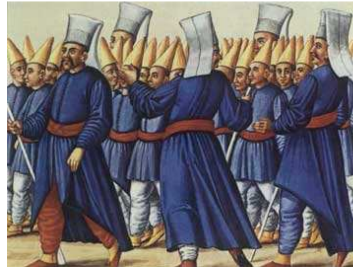
Βίαιη στρατολόγηση νεαρών χριστιανών. Βιέννη, Εθνική Βιβλιοθήκη