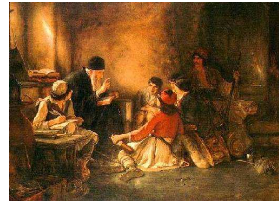
«κρυφό σχολειό» του Νικολάου Γύζη

« Φεγγαράκι μου λαμπρό φέγγε μου να περπατώ να πηγαίνω στο σκολεϊό να μαθαίνω γράμματα γράμματα σπουδάσματα του Θεού τα πράματα»