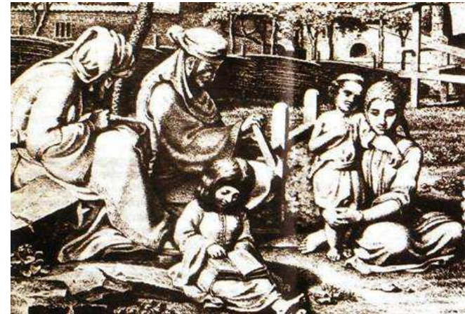
Καθημερινή σκηνή ελληνικής οικογένειας την περίοδο της Τουρκοκρατίας (Γεννάδιος Βιβλιοθήκη, στην Αθήνα). Το μικρό κοριτσάκι διαβάζει, πιθανότατα κάποιο εκκλησιαστικό βιβλίο - γραμμένο στην αρχαιοελληνική γλώσσα- ενώ οι άλλοι επιδίδονται στις διάφορες ασχολίες τους.

Τότε πολλοί λόγιοι της εποχής θα εξάρουν το ρόλο της εκκλησίας και την προσφορά της στη διατήρηση και διάδοση των ελληνικών γραμμάτων στα χρόνια της Τουρκοκρατίας και θα καλλιεργήσουν συστηματικά το μύθο του κρυφού σχολειού.