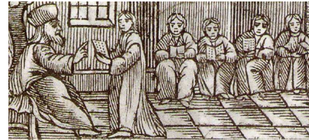
Σχολική τάξη στα χρόνια της οθωμανικής κυριαρχίας. Χρήσιμος παιδαγωγία Βενετία 1777