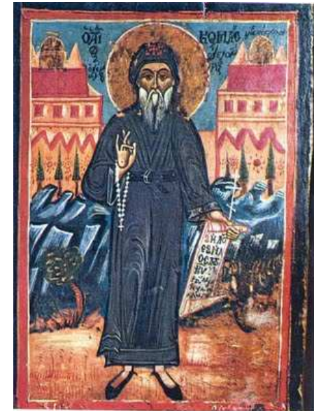
Κοσμάς ο Αιτωλός ίδρυσε πολλά σχολεία

Γεμάτη από αντιφάσεις εξεδηλώνετο η τουρκική πολιτική έναντι των χριστιανών, πάντοτε όμως ρυθμιστής των σχέσεων ήτο η σκοπιμότης και χρυσούς κανών η εξαγορά, ποτέ η αρετή και το δίκαιον».